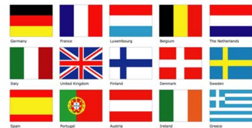
EU-25 Countries (2004)